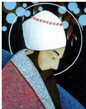
Guru Ram Das